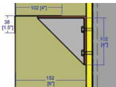
VUE DE SECTION