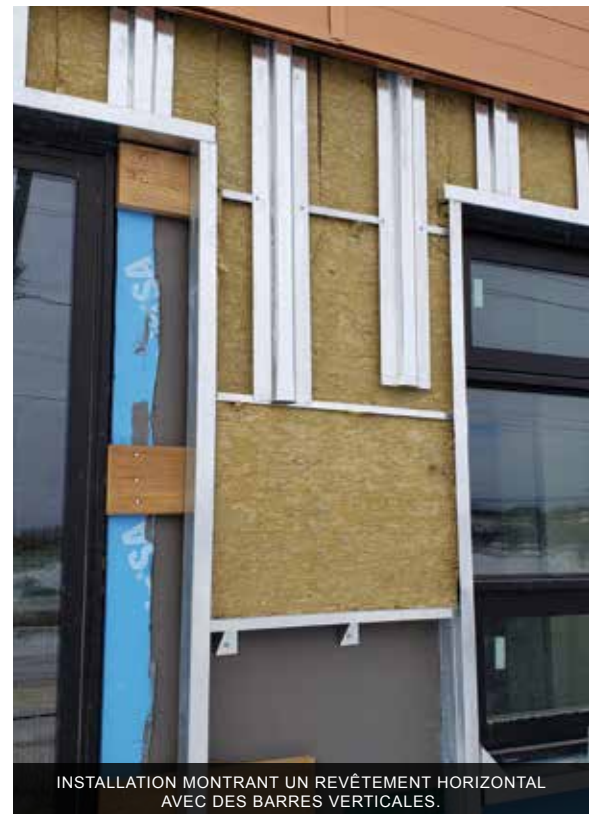
INSTALLATION MONTRANT UN REVÊTEMENT HORIZONTAL AVEC DES BARRES VERTICALES.